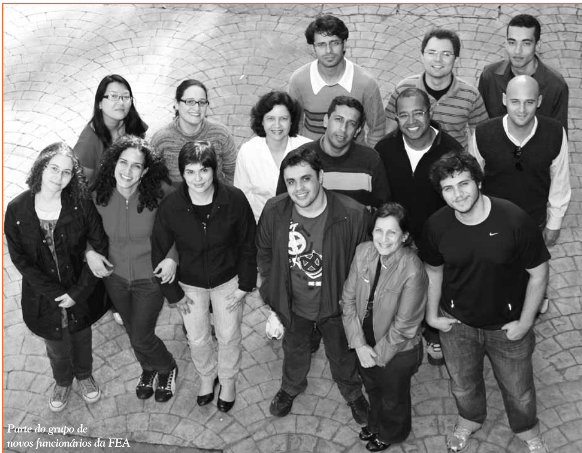
Parte do grupo de novos funcionários da FEA

NO DIA 22 DE JUNHO, UM EVENTO ESPECIAL REUNIU NA SALA DA CONGREGAÇÃO DA FEA OS NOVOS FUNCIONÁRIOS QUE PASSARAM A FAZER PARTE DO QUADRO DA FACULDADE NOS ÚLTIMOS MESES. Foi um encontro de integração, uma oportunidade para as pessoas se conhecerem e entenderem o funcionamento da FEA e o complexo universo da USP.