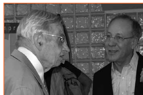
John Nash e Roger Myerson